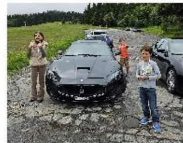
Einmal am Steuer eines Maseratis sitzen und die schnellen Autos aus nächster Nähe erleben.