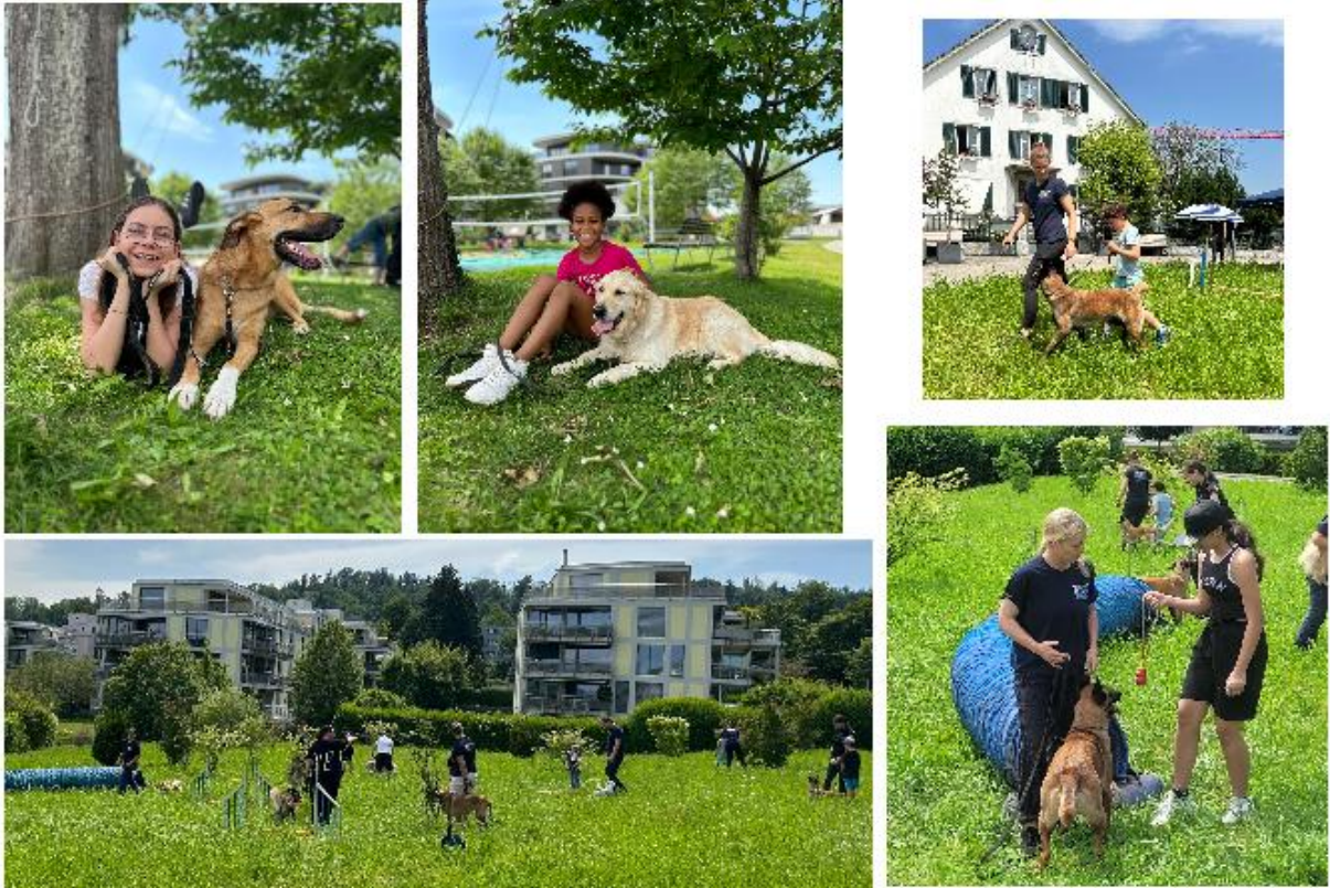
Dieses Angebot sprach alle an, die Hunde mögen und den richtigen Umgang mit ihnen erlernen wollten. Beim Spielen, Trainieren und Streicheln der Therapiehunde war die Freude spürbar.