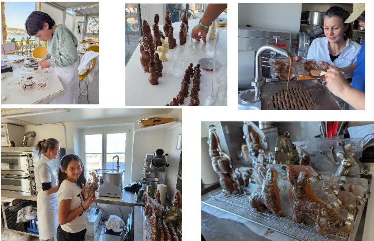
Schoggihasen selbst giessen – und sie danach voller Stolz verschenken oder genussvoll selber essen.