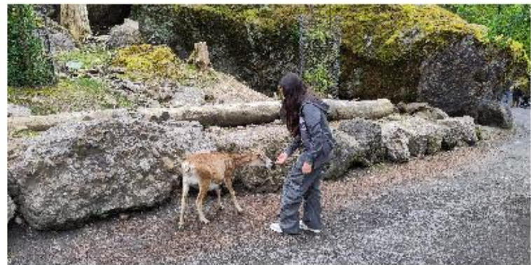
Ob Ausflüge in den Tierpark oder Europapark, kulturelle Erlebnisse wie Konzerte und Musicals oder Sportevents wie Fussballmatches – für alle ist etwas dabei.